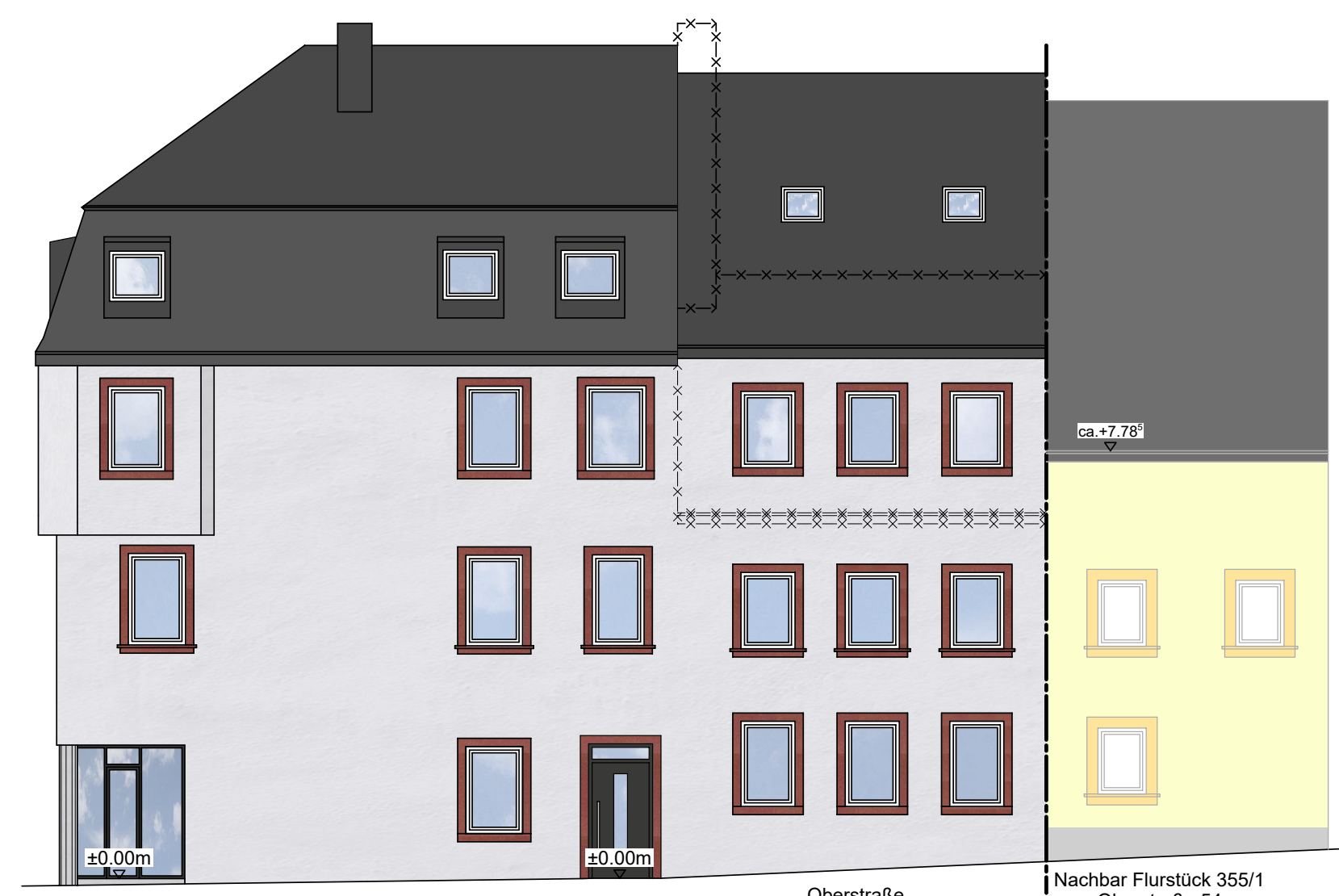
Südost - Ansicht