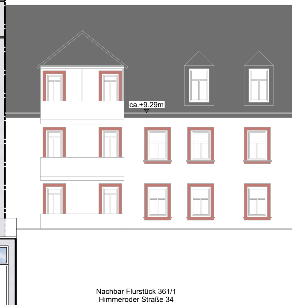
Nachbar Flurstück 361/1 Himmeroder Straße 34