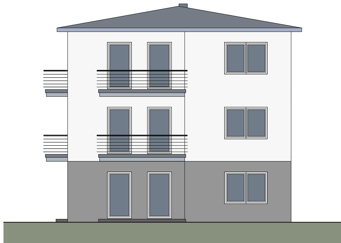
SÜD - OSTEN