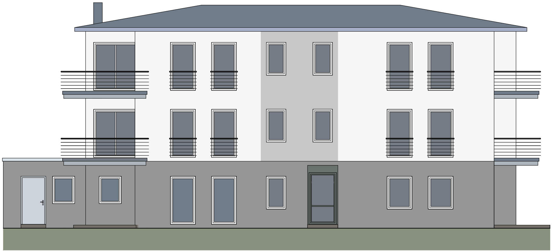
SÜD - WESTEN