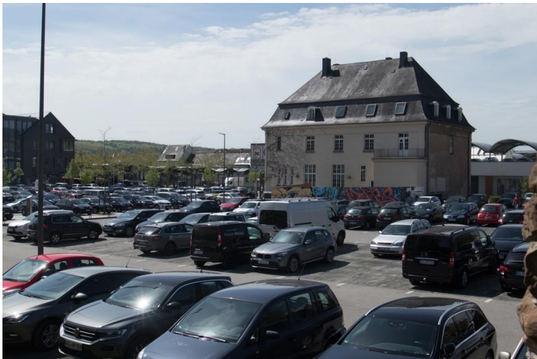
Foto 6: Parkplatz (24.04.2019).