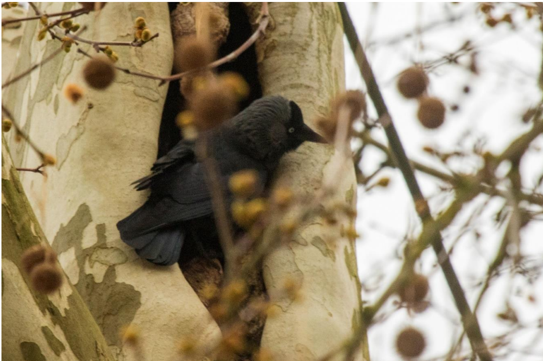
Foto 8: Dohlenbrutplatz in einer direkt nördlich des Plangebietes gelegenen Platane (08.04.2019).