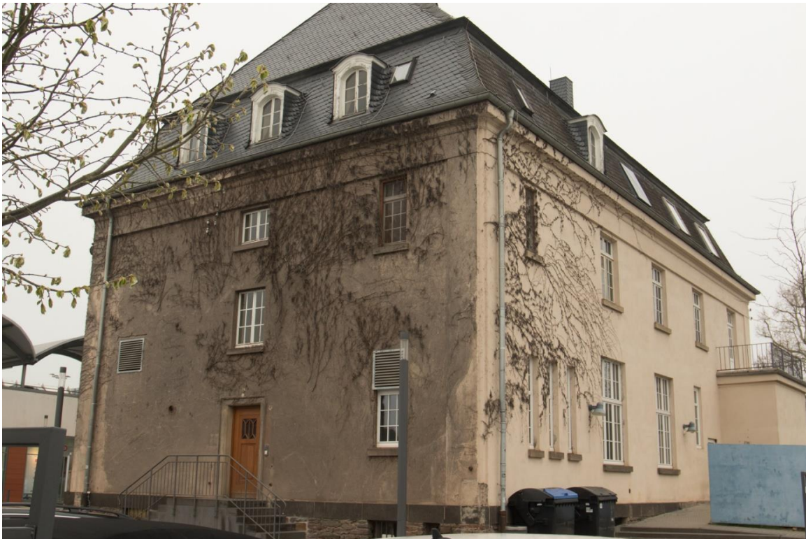
Foto 10: Haus der Jugend (08.04.2019).