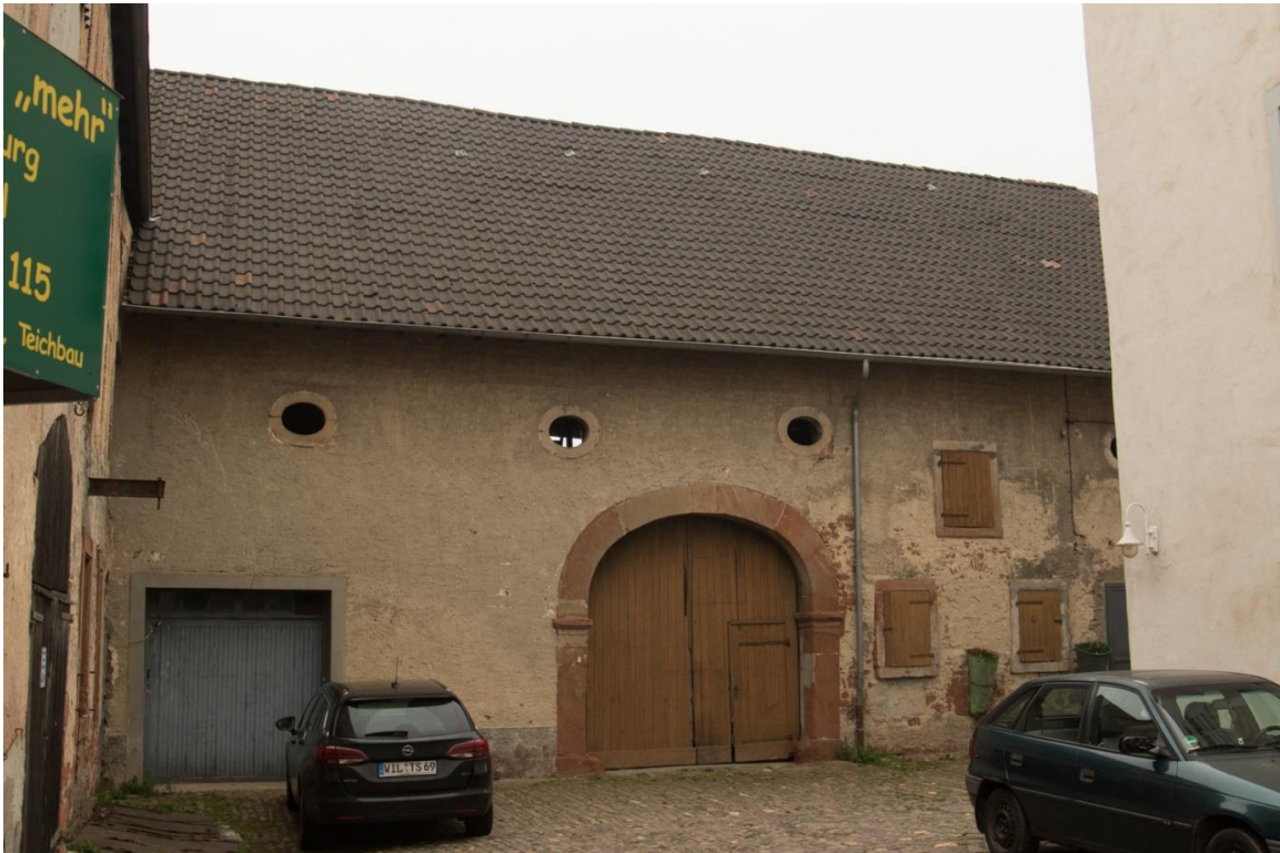
Foto 1: Nordseite der Scheune (08.04.2019).