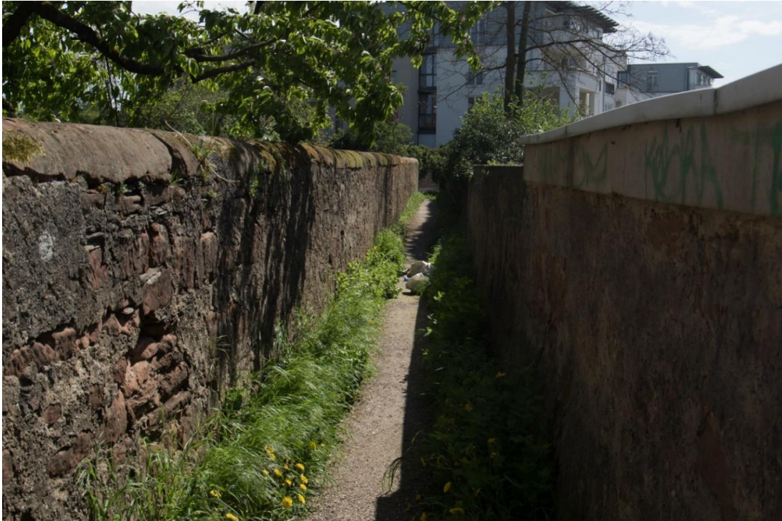
Foto 7: Bruchsteinmauer entlang der Parfümgasse (24.04.2019).