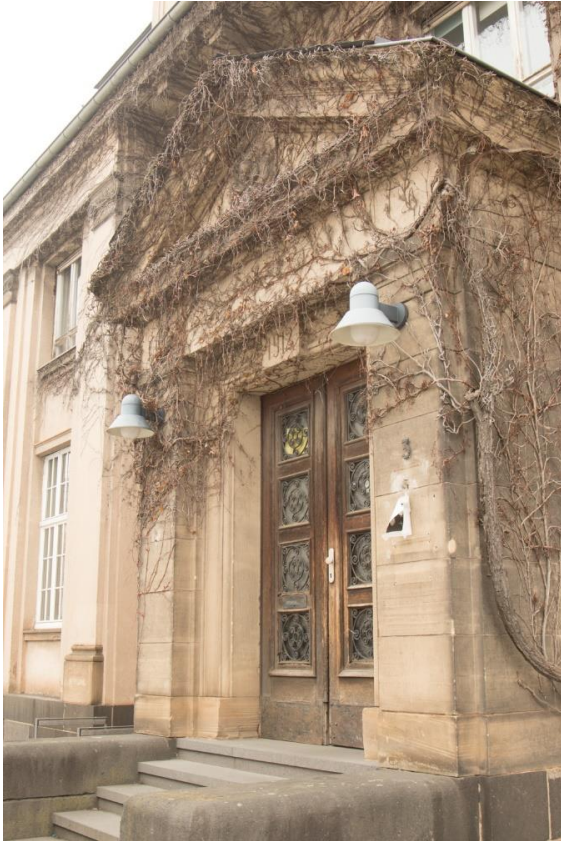
Foto 9: Eingang zum "Haus der Jugend" (08.04.2019).