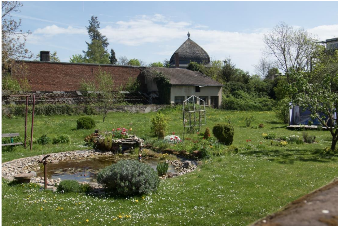
Foto 5: Südöstlicher Bereich des Gartens (24.04.2019).