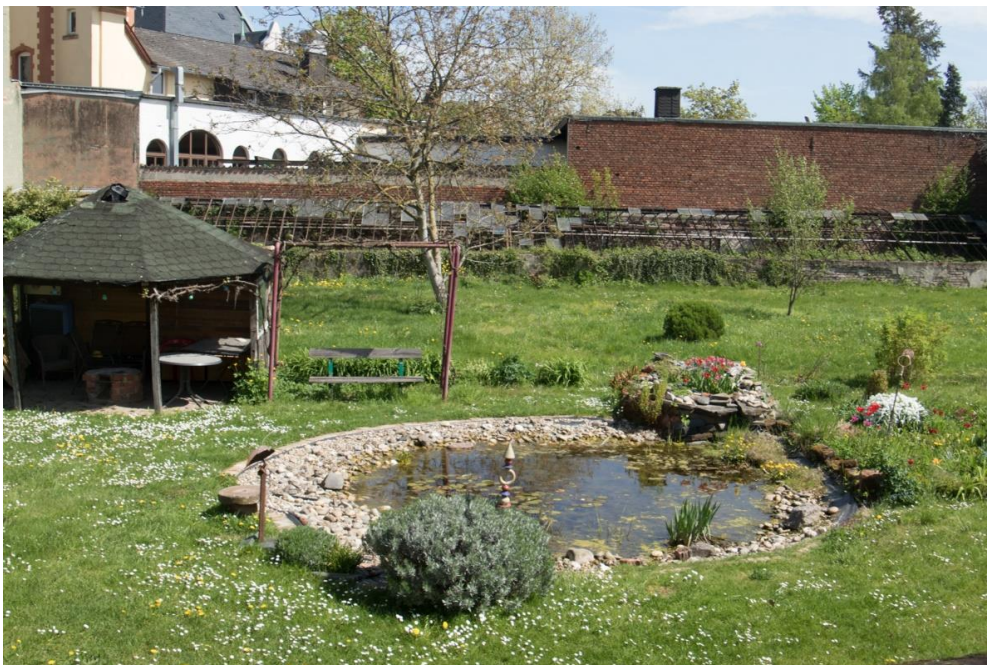
Foto 4: Zierteich innerhalb des gepflegten Gartenbereichs (24.04.2019).