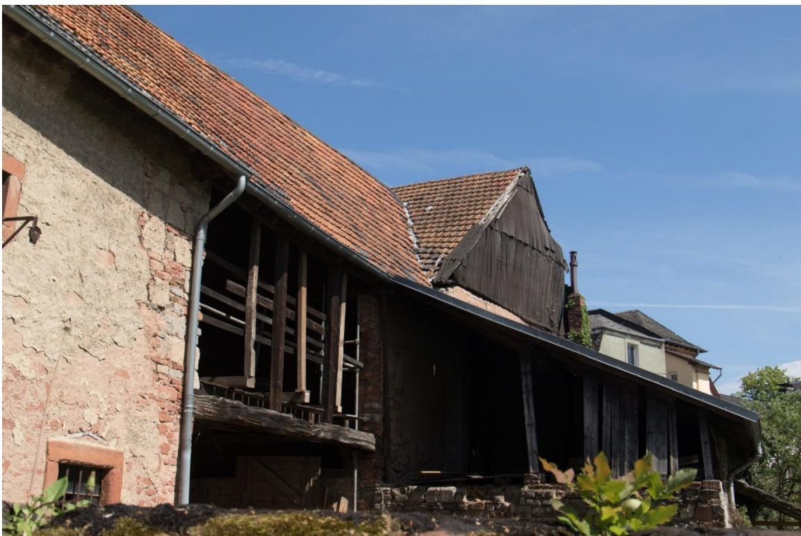
Foto 2: Südseite der Scheune (24.04.2019).