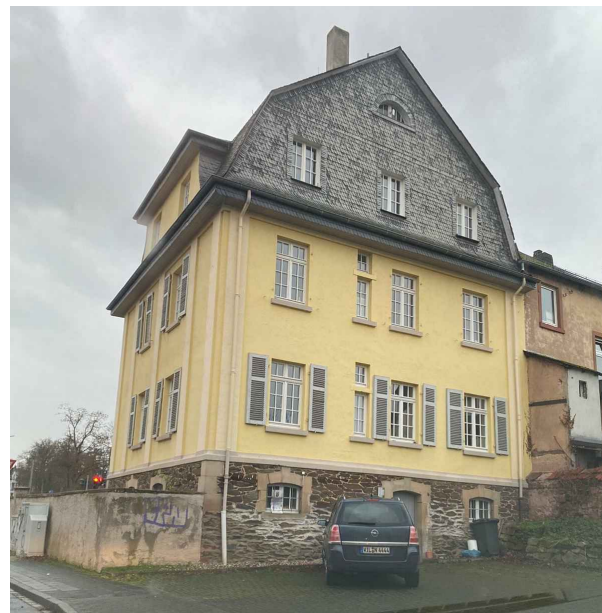
ANSICHT von Lieserstraße