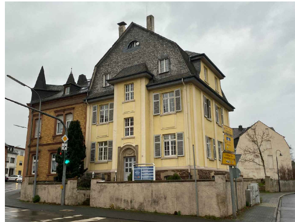
ANSICHT von Trierer Landstraße