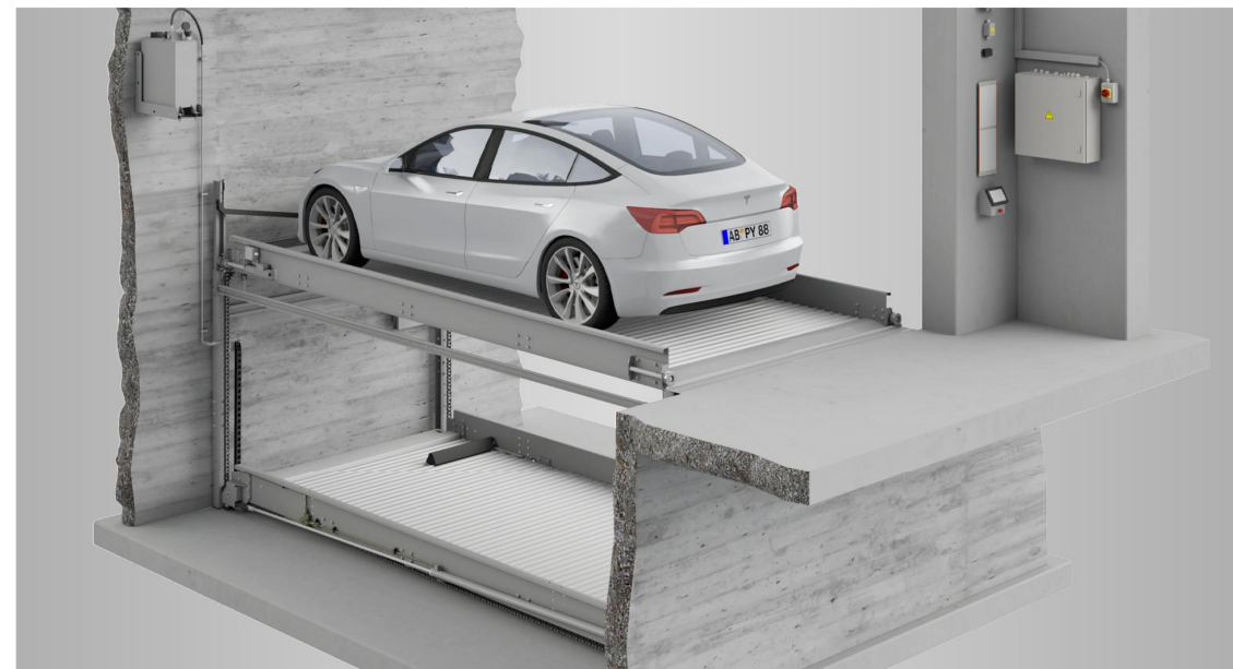
PARKSYSTEM = alftechnik GmbH www.alftechnik.ch