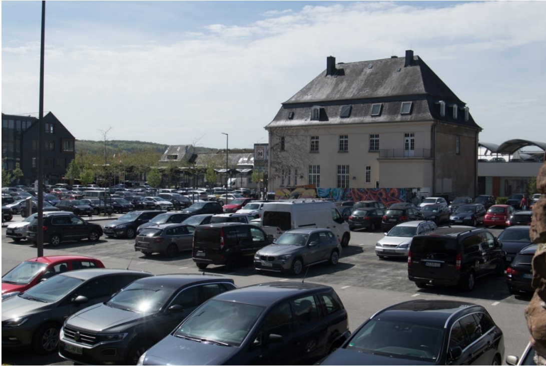
Foto 1: Parkplatz (24.04.2019).