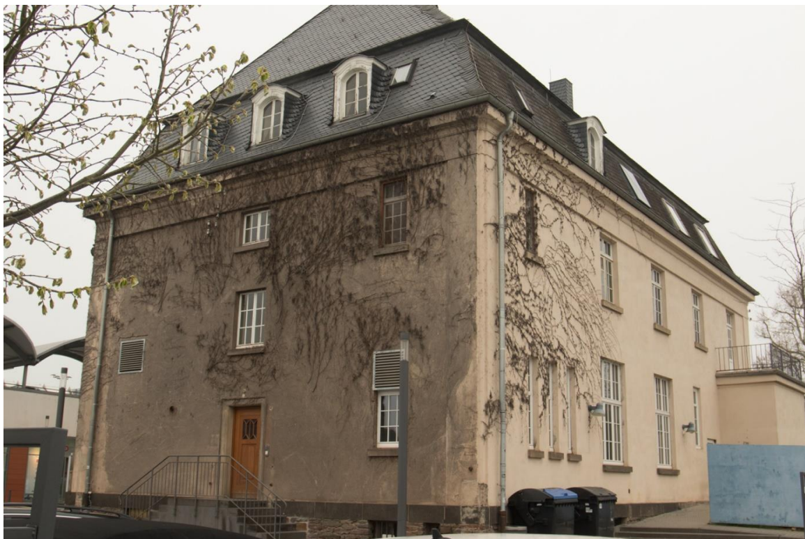
Foto 4: Sogenanntes „Haus der Jugend“ (08.04.2019).