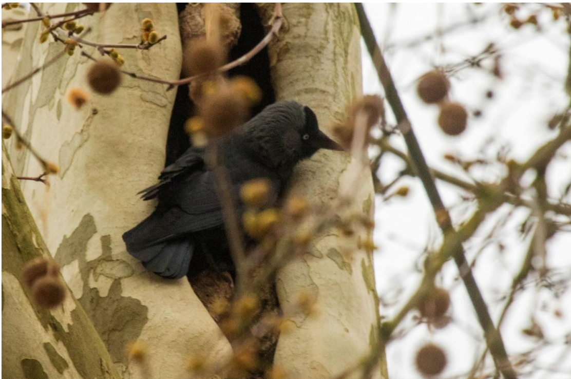
Foto 2: Dohlenbrutplatz in einer direkt nördlich des Plangebietes gelegenen Platane (08.04.2019).