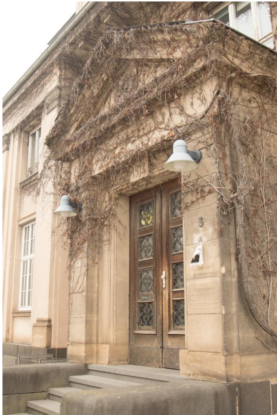
Foto 3: Eingang zum sogenannten "Haus der Jugend" (08.04.2019).