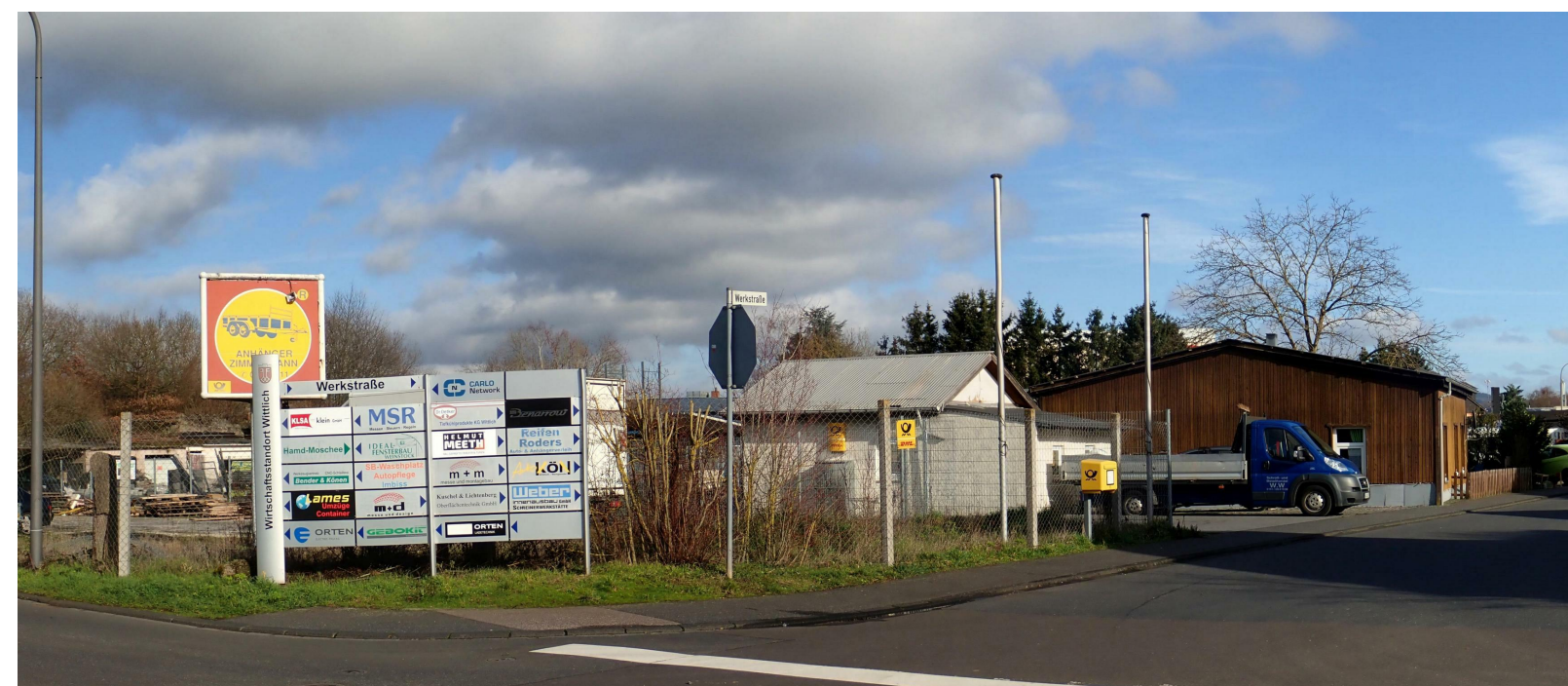
Kreuzung Bahnhofstraße / Werkstraße / Brunnenstraße