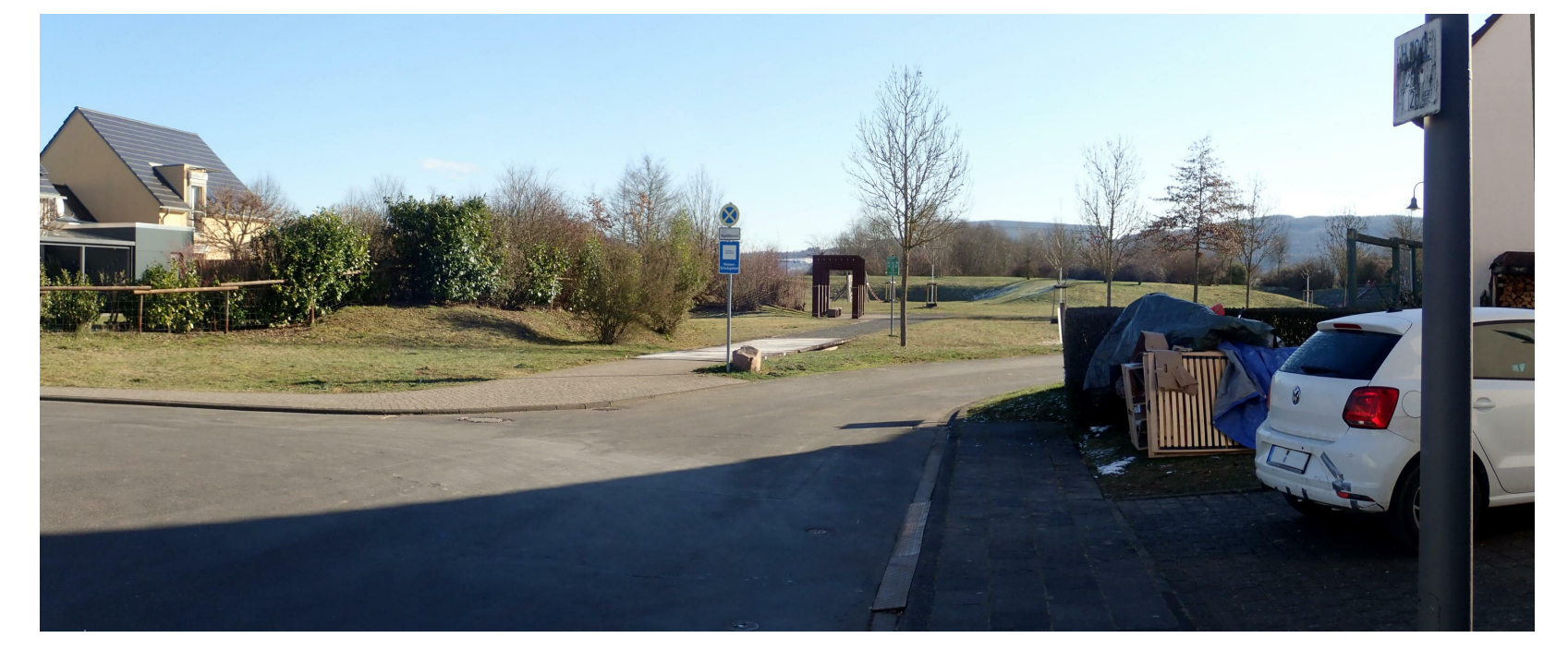
Fürstelstraße / Wendeanlage