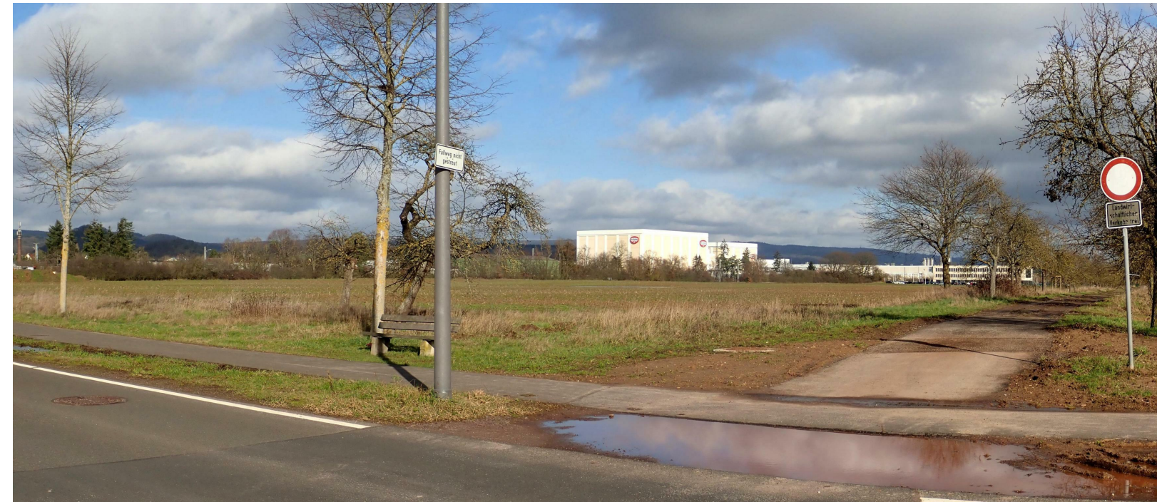
Europastraße / Einmündung Wahlholzerstraße