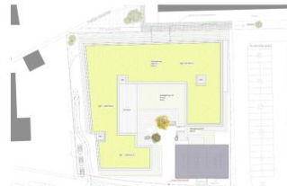
Dachaufsicht (M 1:1500)