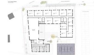
1. Obergeschoss (M 1:1500)