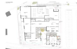
Erdgeschoss (M 1:1500)