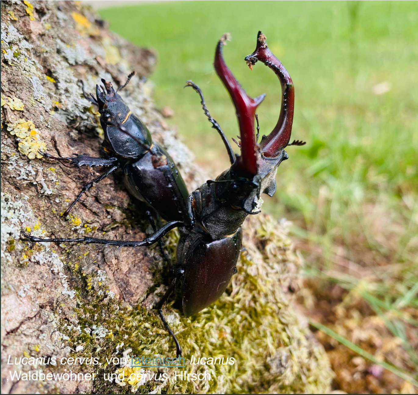
Lucanus cervus , von lateinisch lucanus 'Waldbewohner' und cervus 'Hirsch'