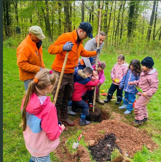
Tag des Baumes 2022