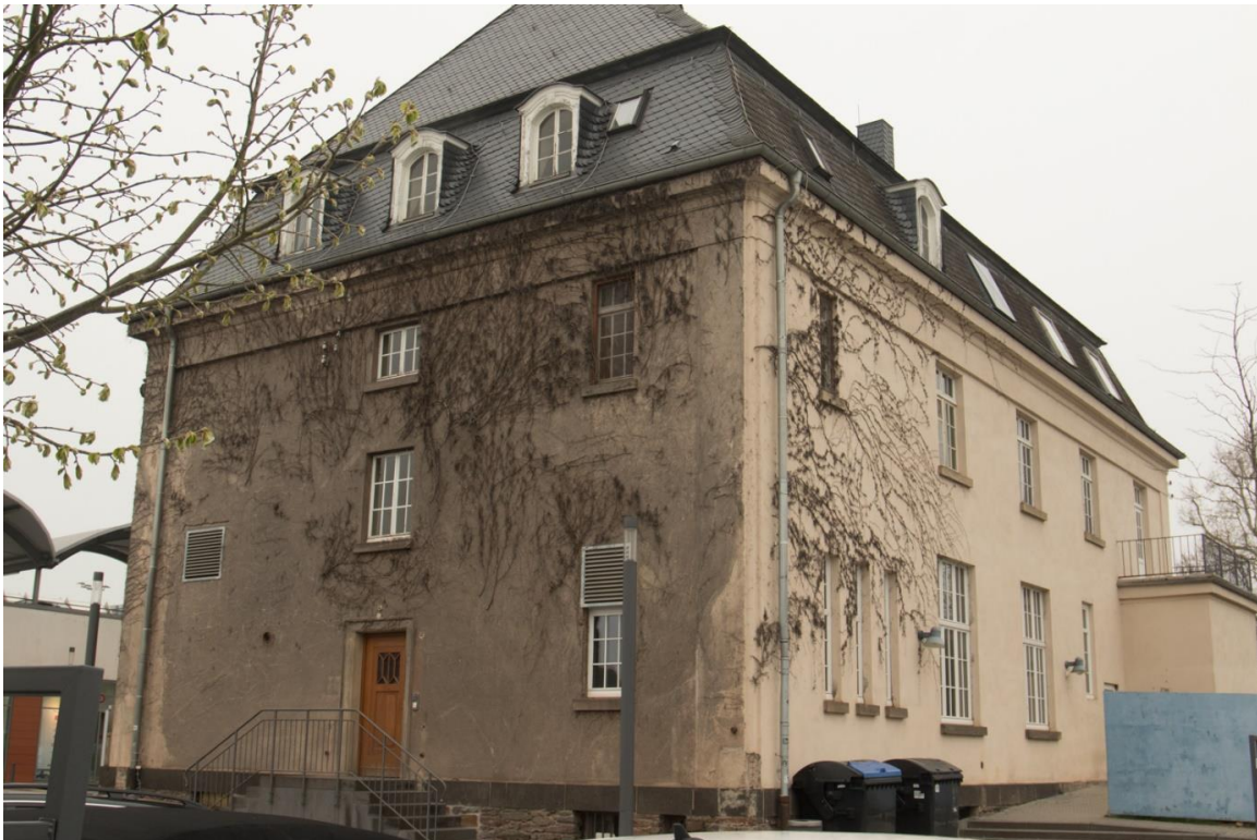
Foto 4: Sogenanntes „Haus der Jugend“ (08.04.2019).