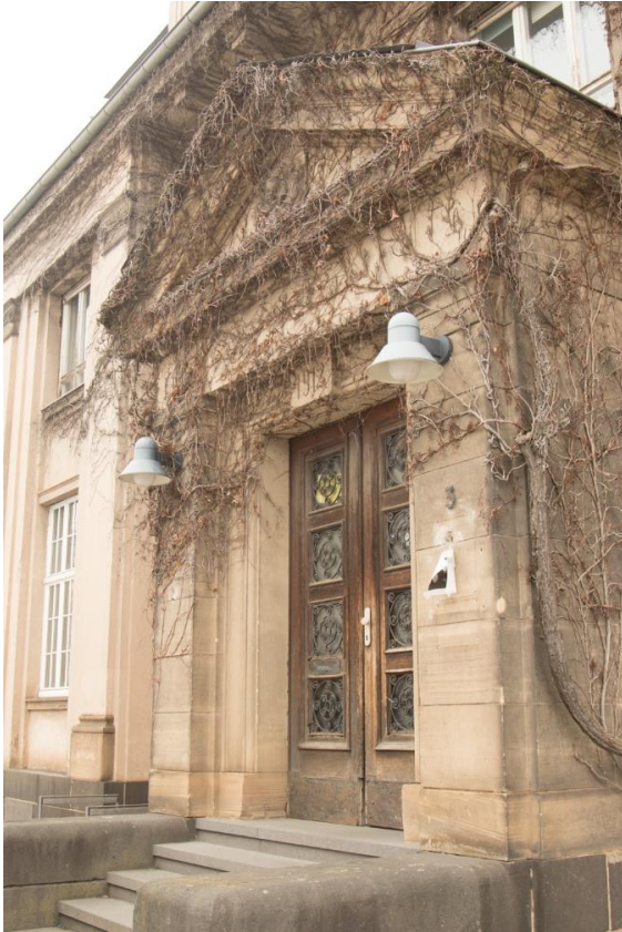
Foto 3: Eingang zum sogenannten "Haus der Jugend" (08.04.2019).