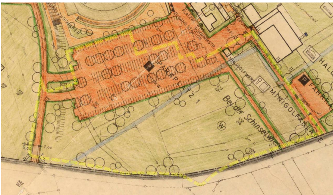
Abbildung 3: Überlagerung Ursprungsbebauungsplan und Geltungsbereich der 1. Änderung (gelbe Linie)

Infolge der gewählten Geltungsbereichsabgrenzung im Süden ragt der Änderungsbereich beim Einmündungstrichter der Himmeroder Straße in die Kreisstraße spornartig leicht über den Geltungsbereich des Ursprungsbebauungsplans heraus. Wegen Geringfügigkeit dieser Flächengröße ist die Änderung des Bebauungsplans auch im Rahmen des § 13 a BauGB möglich.