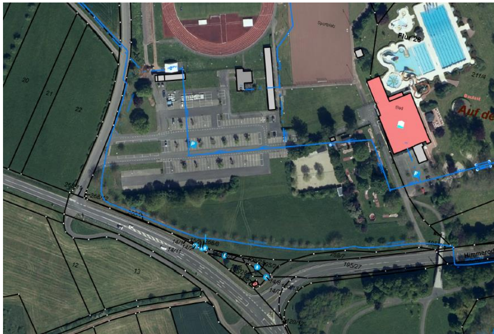
Abbildung 1: Verlauf bestehender Wasserleitungen (blaue Linien)

Die vorhandenen Wasserleitungen dürfen nicht überbaut und bepflanzt werden. Dies ist im Rahmen des Bebauungsplanes auch nicht vorgesehen. Bei den betroffenen Bereichen handelt es sich um Flächen, die im Bestand übernommen und gesichert werden, ohne dass dort eine Überbauung oder Baumneupflanzungen festgesetzt werden.