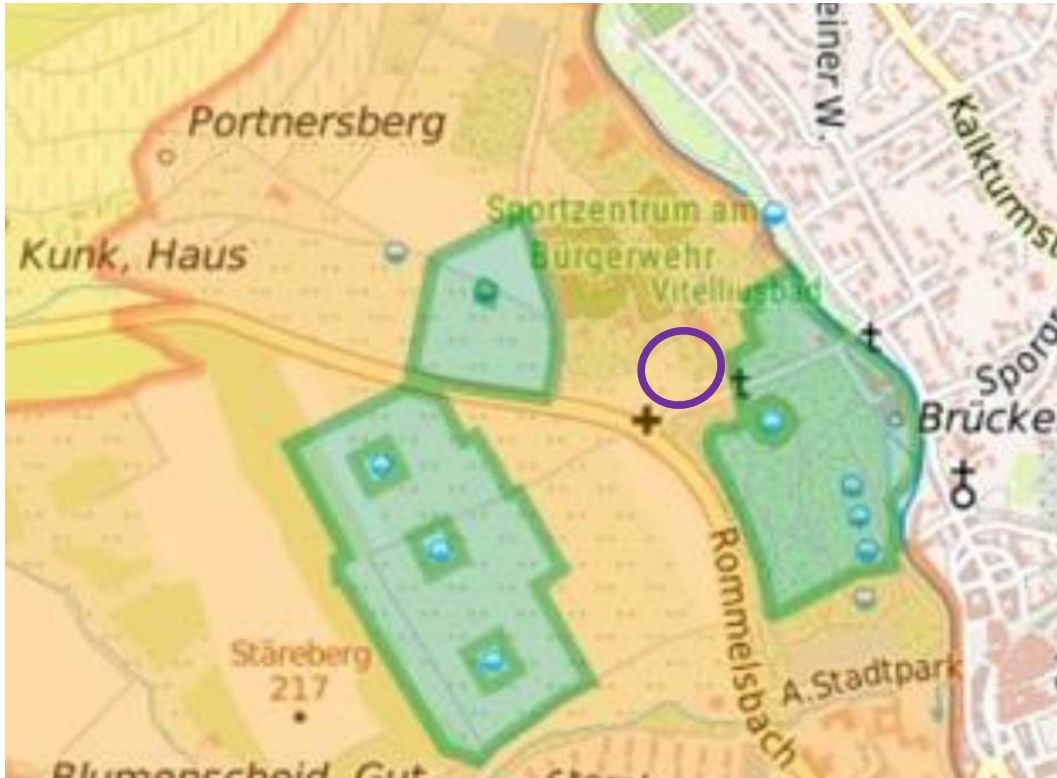
Abbildung 5: Neuabgrenzungsentwurf WSG (grüne Umrandung Zone II, orange Umrandung Zone III)

Der Geltungsbereich der 1. Änderung liegt räumlich im vorgesehenen Wasserschutzgebiet, WSG 100 Stareberg-Seiberich, amtl. Nr. 405110163 innerhalb der nunmehr abgegrenzten Schutzzone III B (weitere Schutzzone).