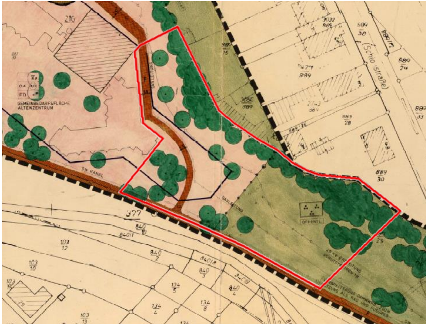
Abb. 4. Ausschnitt des rechtsgültigen BPlan Ohling-Schweiz (W-27-00) mit ungefährender Lage des Plangebietes (blau).

Im rechtsgültigen Bebauungsplan Ohling-Schweiz (W-27-00) ist das Plangebiet als Gemeinbedarfsfläche Altenzentrum und als öffentliche Grünfläche/ Parkanlage festgesetzt. Im Rahmen der weiteren Planungen ist eine entsprechende Änderung des bestehenden Bebauungsplans W-27-00 geplant.