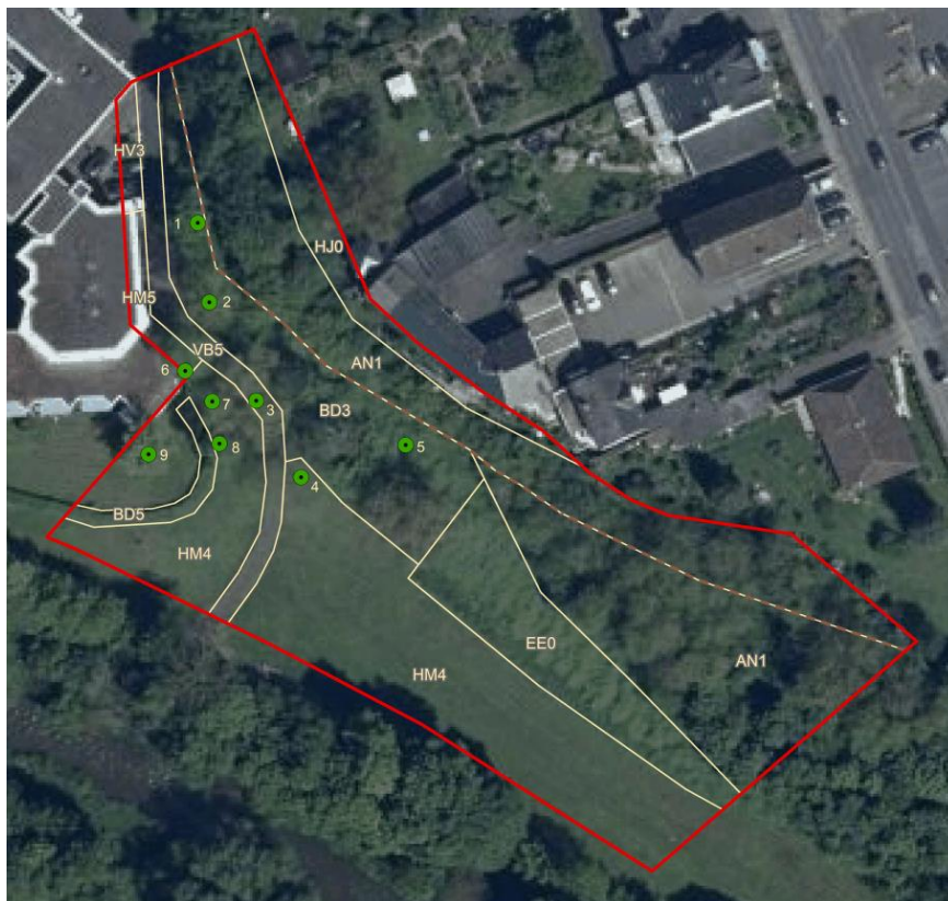
Abb. 2. Luftbild (Stand 13.05.2019) mit Bestandsschätzung (BGHplan) im Geltungsbereich (rot). AN1 – Robinienmischwald, BD3 – Gehölzstreifen, BD5 – Schnitthecke, EE0 – störzeigerdominierte Grünlandbrache, HJ0 – Gärten, HM4 – Parkrasen, HM5 – Pflanzenbeet, HV3 - Parkplatz, VB5 – Rad-, Fußweg. Der Hangfuß ist braun gestrichelt, markante Einzelbäume sind in grün dargestellt (1-9, vgl. Tab. 1).

Das Plangebiet besteht zum überwiegenden Teil aus einer Grünanlage, die in den Randbereichen von Bäumen und Gehölzstrukturen eingefasst ist (s. Abb. 2). Die Gehölzstrukturen liegen am Fuße und oberhalb einer Felswand (10-12 m), welche durch das Plangebiets verläuft. Der Gehölzstreifen im Bereich des Altenheims ist geprägt durch Robinien, Feldahorn, Eibe und beinhaltet markante ortsbildprägende Einzelbäume (s. Tab. 1). Der Bestand oberhalb der Hangkante wird von Robinien dominiert, im Osten des Gebiets durchmischt sich der Robinienbestand mit Feldahorn und Hasel. Die Grünanlage weist vor dem Gehölzbestand brache von Brennnesseln und Brombeeren dominierte Bereiche auf. Ein Fußweg verläuft im Westen durch das Gebiet, welcher an den Rad-/Fußweg südlich des Plangebietes anschließt.