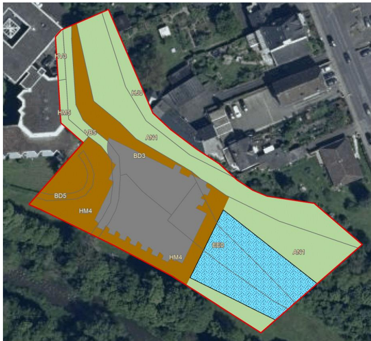
Abb. 5. Abschätzung der Auswirkungen der Planung gemäß frühem Planungsstand (21.10.2020). Erhaltflächen: grün, überplante Flächen: orange, davon Hospiz: grau, Flächen für die Rückhaltung und Versickerung von Niederschlagswasser: blau. Biotoptypen Codierung gemäß Abb. 2.

Werden im weiteren Verfahren ergänzt bzw. angepasst.