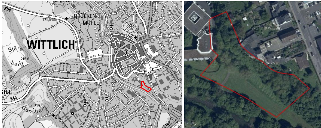
Abb. 1. Lage des Plangebiets (rot) in der Stadt Wittlich (links) und Luftbild (LANIS RLP, rechts).

Neben der baulichen Umsetzung soll auch eine Gestaltung des Umfelds vorgenommen werden. Hierzu gehören auch die Zuwegung über den verlängerten Anschluss an die Wendeanlage der Straße Zur Schweiz. Zusätzlich muss Retentionsraum geschaffen werden, der ermittelt und im Plangebiet ebenfalls verortet wurde. Die durch die Verlegung von Strom und Gasleitungen erforderlichen Trassen sind in der Planung berücksichtigt.