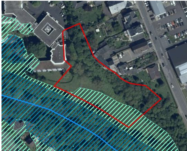
Abb. 6. Gesetzl. Überschwemmungsgebiet (blau schraffiert) und hochwassergefährdetes Gebiet (HQextrem) (türkis schraffiert) der Lieser (blau) im Bereich des Plangebiets (rot).