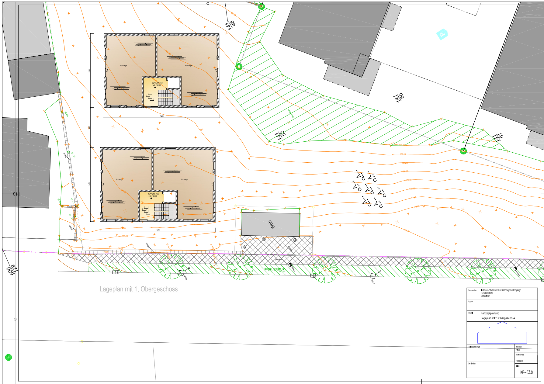
Lageplan mit 1. Obergeschoss