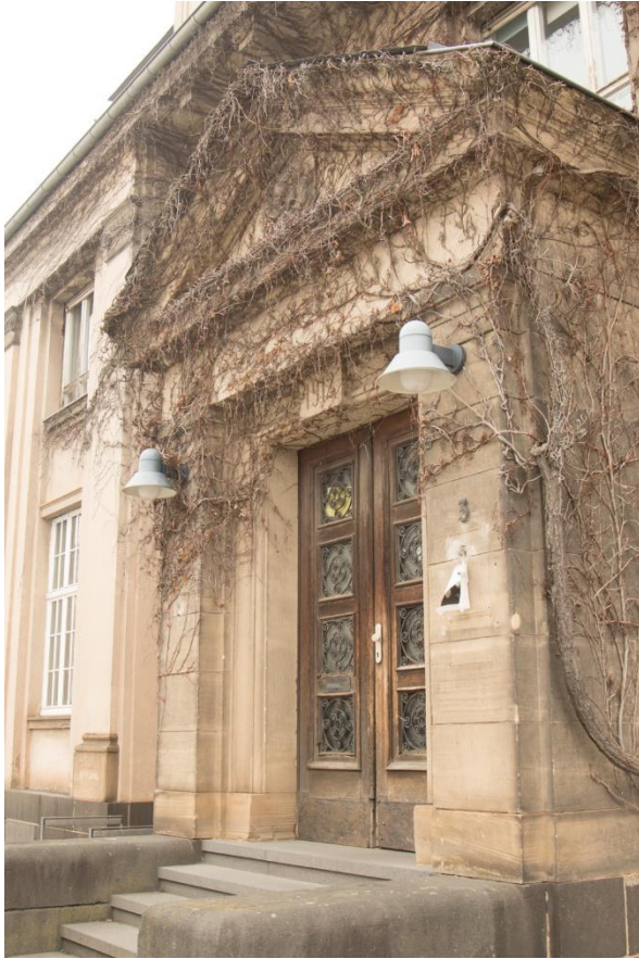
Foto 9: Eingang zum "Haus der Jugend" (08.04.2019).