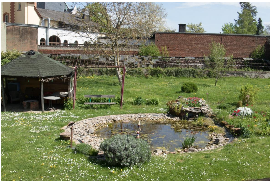
Foto 4: Zierteich innerhalb des gepflegten Gartenbereichs (24.04.2019).