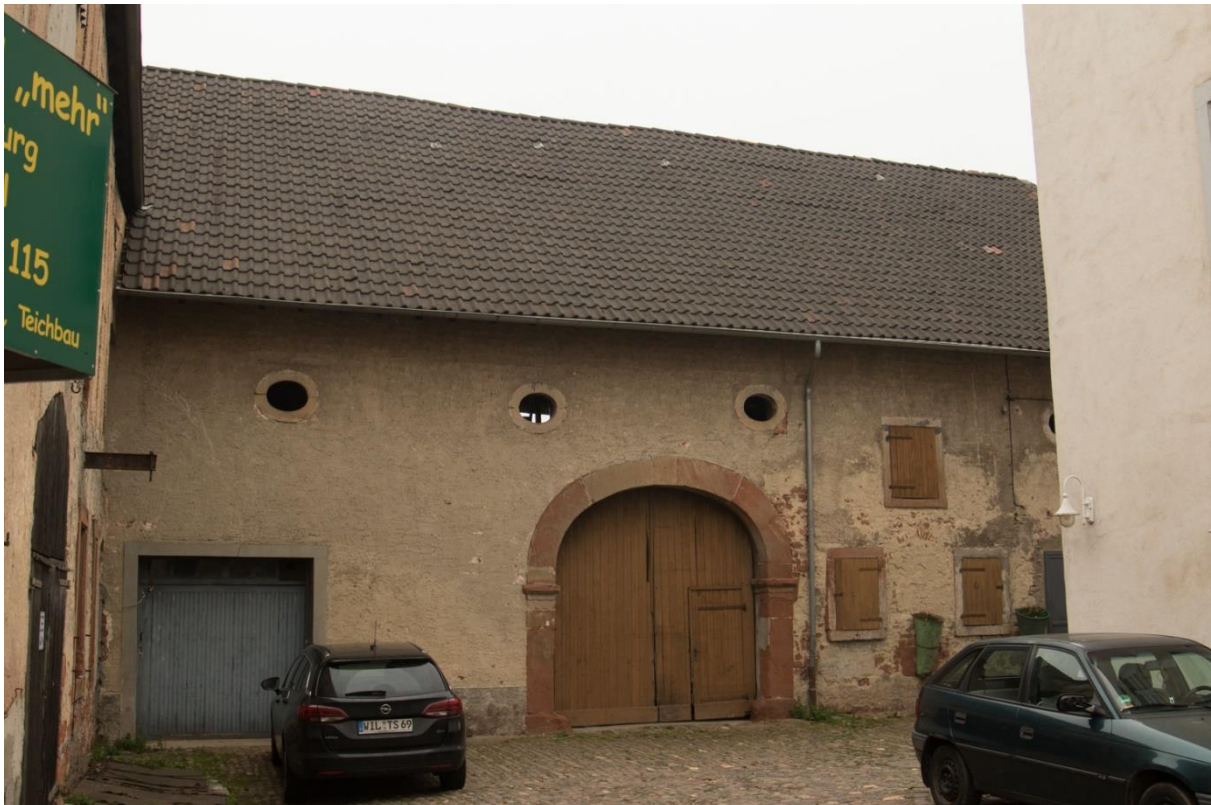
Foto 1: Nordseite der Scheune (08.04.2019).