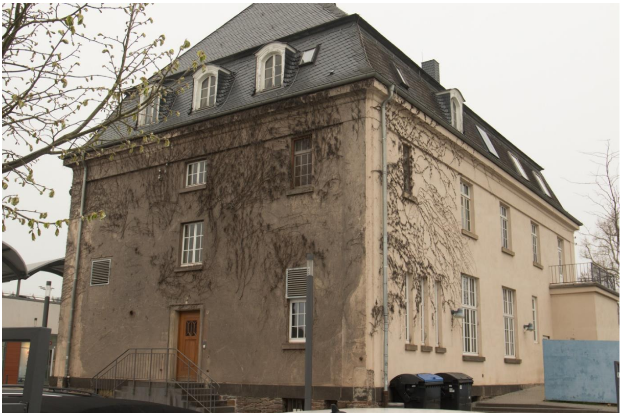
Foto 10: Haus der Jugend (08.04.2019).