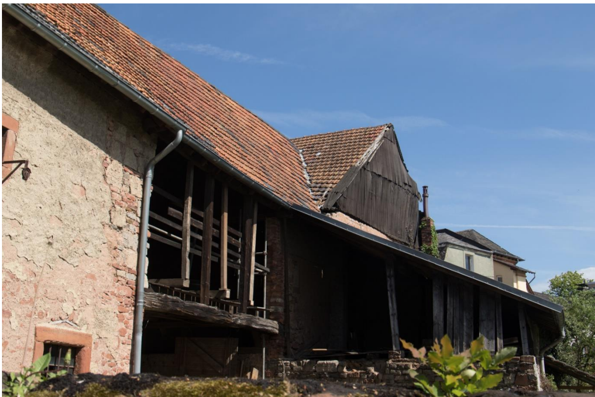
Foto 2: Südseite der Scheune (24.04.2019).