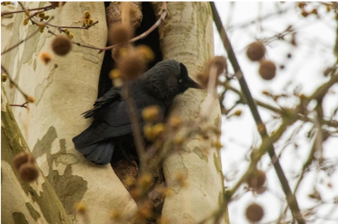
Foto 8: Dohlenbrutplatz in einer direkt nördlich des Plangebietes gelegenen Platane (08.04.2019).