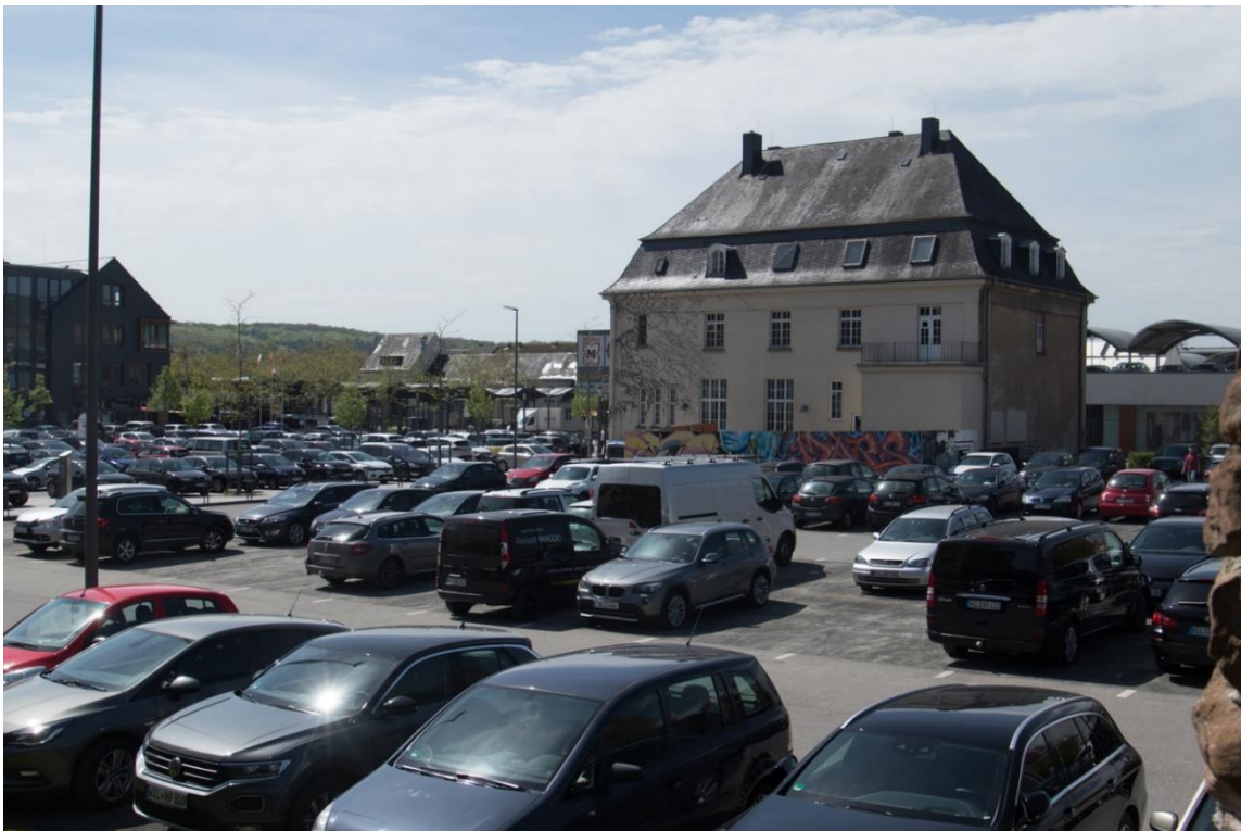
Foto 6: Parkplatz (24.04.2019).