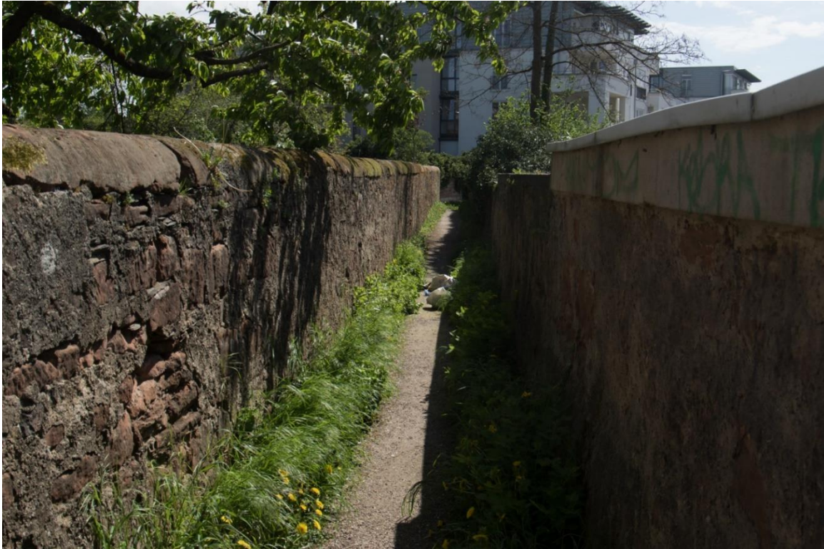
Foto 7: Bruchsteinmauer entlang der Parfümgasse (24.04.2019).