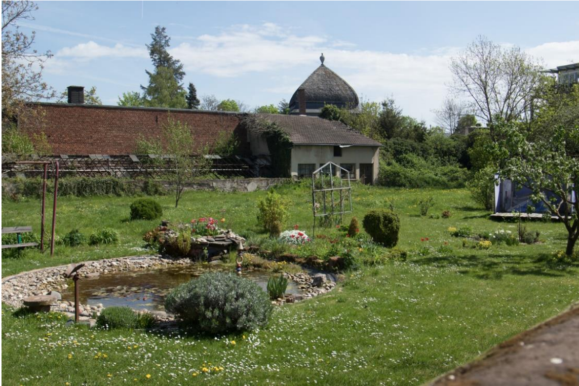
Foto 5: Südöstlicher Bereich des Gartens (24.04.2019).