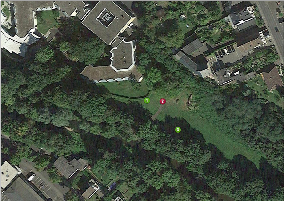
Abbildung 3: Luftbild – Lage der Erkundungsstellen im Gelände (grün) und auf dem Gehweg (rot)