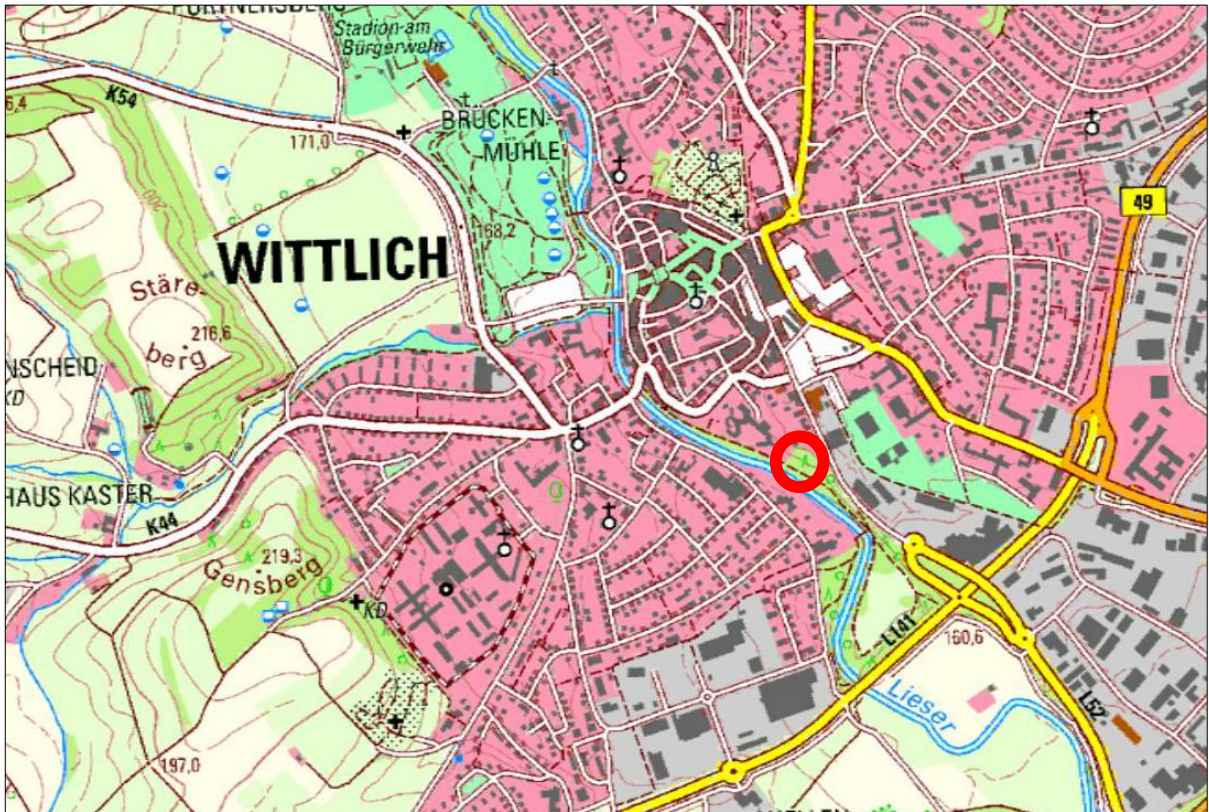
Abbildung 1: Übersichtslageplan (TK 25) – Lage des Untersuchungsgebietes (rote Markierung)